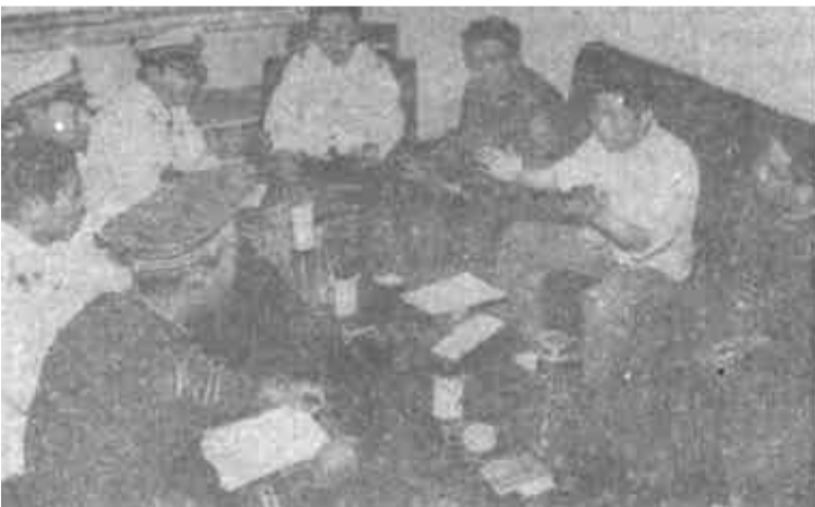
河口区交通局交警队坚持每周一个政治学习日制度。强有力的思想政治工作，激发了干警们的工作热情，使他们保持了廉洁勤政的优良作风。自1987年以来，该队连续三年被省交通厅评为“双文明”单位。图为干警们在进行政治学习。